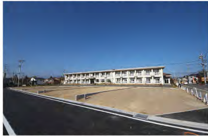
分譲地内、北側の5区画は南道路で陽当たり良好