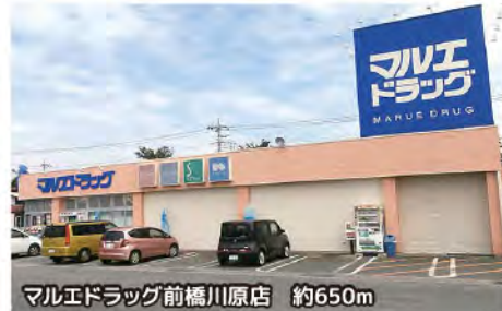
マルエドラッグ前橋川原店 約650m