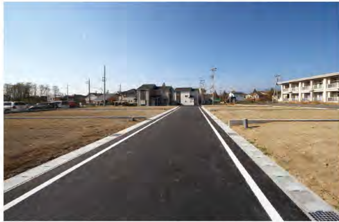
分譲地内6.0m道路。西詰で所有者以外の一般車両が入ることも少ないです