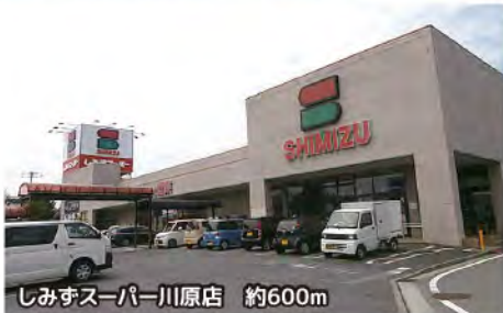
しみずスーパー川原店 約600m

小学校・保育園・公園も近くにあり、お子様の通学や送り迎えなど、子育て環境も良好。 コンビニ・スーパー・ドラッグストアは徒歩8分圏にあり、日々の買い物も便利。 国道17号線や上毛大橋も近く、前橋市中心市街地や吉岡町・渋川市へのアクセスも良好。