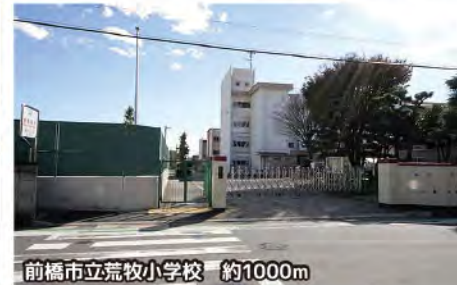
前橋市立荒牧小学校 約1000m