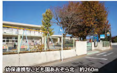
幼保連携型こども園あおぞら北 約260m